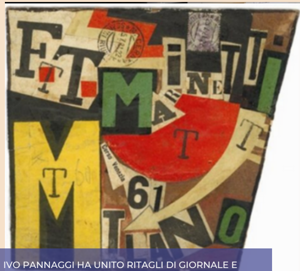
IVO PANNAGGI HA UNITO RITAGLI DI GIORNALE E FRANCOBOLLI PER SCRIVERE IL NOME E L'INDIRIZZO DI FILIPPO TOMMASO MARINETTI.

Nonostante il fatto che l'era del lockdown abbia messo a dura prova la produzione artistica, ha anche prodotto alcune forme di creazione alternative frammentarie e ha fatto rivivere quelle vecchie. Mesi di quarantena hanno inaugurato un mini-rinascimento per la mail art, un genere vecchio di decenni. Molti artisti si sono rivolti a un'alternativa decisamente low-tech a Internet, il servizio postale, impegnandosi con la storia della mail art, condividendo opere d'arte fisiche e creando connessioni, anche in isolamento.