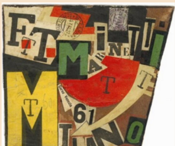
Ο ΙΒΟ ΡΑΝΝΑΓΓΙ ΧΡΗΣΙΜΟΠΟΙΗΣΕ ΑΠΟΚΟΜΜΑΤΑ ΕΦΗΜΕΡΙΔΩΝ ΜΕ ΣΤΟΧΟ ΝΑ ΓΡΑΨΕΙ ΤΟ ΟΝΟΜΑ ΚΑΙ ΤΗΝ ΔΙΕΥΘΥΝΣΗ ΤΟΥ ΦΙΛΙΠΠΟ ΤΟΜΜΑΣΟ ΜΑΡΙΝΕΤΤΙ.

Παρά το γεγονός ότι η εποχή του lockdown έχει επηρεάσει αρνητικά την καλλιτεχνική παραγωγή, και έχει επίσης αποφέρει κάποιες άχρηστες, εναλλακτικές μορφές κατασκευής, οι μήνες καραντίνας οδήγησαν σε μια μίνι-αναγέννηση του mail art, ένα είδος τέχνης που υπάρχει εδώ και δεκαετίες. Πολλοί καλλιτέχνες έχουν στραφεί σε λιγότερο τεχνολογικές λύσεις όπως το ταχυδρομείο—και ασχολούνται με την ιστορία της mail art, μοιράζοντας με φυσικό τρόπο τα έργα τους και δημιουργώντας επαφές και με απομακρυσμένους προορισμούς.