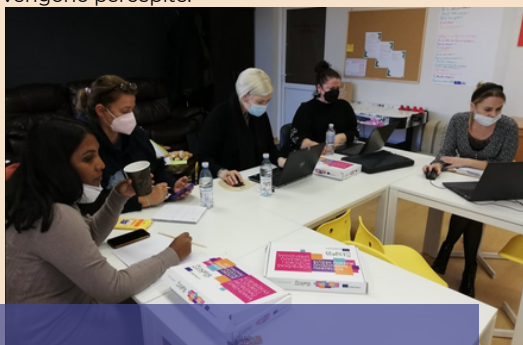
I MEETING IN SIAULIAI

Secondo l'OMS (2020), il COVID-19 sta cambiando la routine quotidiana delle persone anziane, l'assistenza e il supporto che ricevono, la loro capacità di rimanere socialmente connessi e il modo in cui vengono percepite.