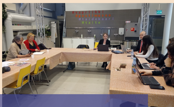
II MEETING IN TAMPERE

I dati Eurostat suggeriscono che il 19,2% delle persone in Europa sono ora considerate persone anziane. Questo è 1 su 5! È importante creare opportunità per gli anziani durante la pandemia per far fronte alla solitudine e all'isolamento che incidono negativamente sulla loro vita quotidiana e sul loro benessere fisico e mentale.