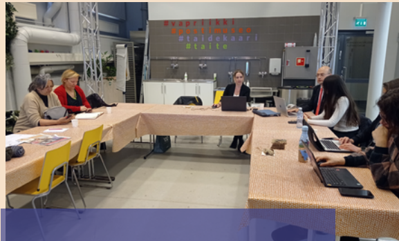
2. PARTNERITAPAAMINEN TAMPEREELLA

Eurostatin tiedot osoittavat, että Euroopassa 19,2 % ihmisistä kuuluu ikäihmisten ryhmään. Se on yksi viidestä! On tärkeää, että luomme seniorikansalaisille mahdollisuuksia selviytyä pandemian aikana yksinäisyydestä ja eristäytymisestä, jotka vaikuttavat haitallisesti heidän jokapäiväiseen elämäänsä sekä fyysiseen ja henkiseen hyvinvointiin.