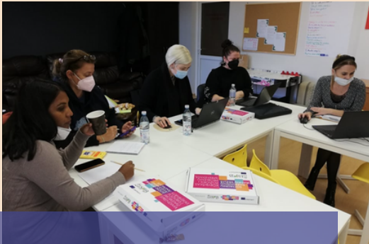
1. PARTNERITAPAAMINEN SIAULIAISSA

AMaailman terveysjärjestön (WHO) mukaan (2020) COVID-19 muuttaa ikääntyvien ihmisten päivittäisiä rutiineja, heidän saamaansa hoivaa ja tukea, heidän kykyään pysyä sosiaalisesti yhteydessä sekä sitä, miten heidät nähdään.